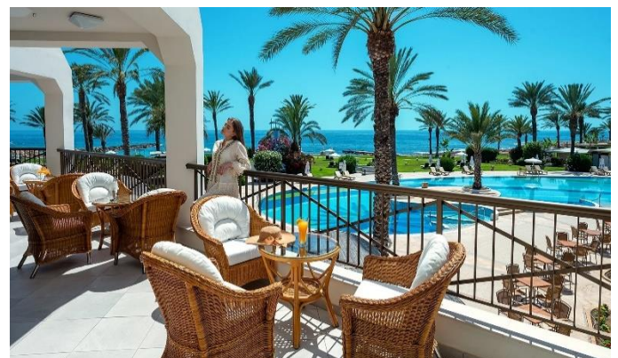
Constantinou Bros Athena Beach Hotel