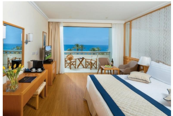
Constantinou Bros Athena Beach Hotel

Eine Bushaltestelle befindet sich direkt vor dem Hotel, und Taxis stehen jederzeit zur Verfügung.