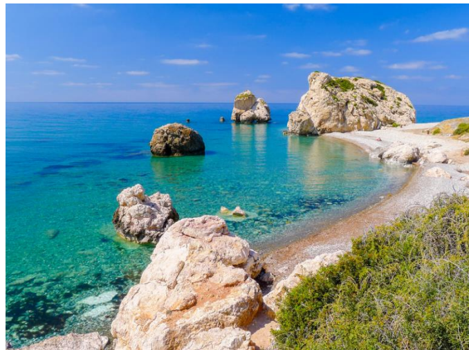
Felsen der Aphrodite